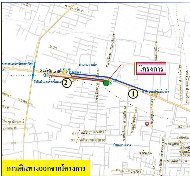
รูปที่ 1-2 เส้นทางคมนาคมเข้า-ออกโครงการ